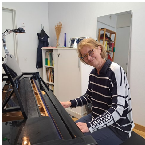
Salsa-luokassa sorvin ääressä.

“Luovuus! Ongelmanratkaisu ja myös visuaalinen miettiminen taittamisessa. Koen, että kirjoittaminen on tavallaan kommunikointia ihmisten kanssa, ja