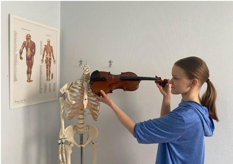
Viulunsoittokin vaatii hyvää ergonomiaa.

Opiskelun myötä ihailen ja arvostan viuluoppilaitani ja heidän heittäytymiskykyään, pitkäjänteisyyttään ja rohkeuttaan entistäkin enemmän. Toisaalta oma itseluottamukseni opiskelutaitoihin, teorian sekä konkretian yhdistämiseen ja yleisesti oppimiseen liittyen nousi. Uskon tämän auttaneen myös Suzuki-opettajan koulutuksen viimeistelyssä viime vuodenvaihteessa. Puhumme usein isompien oppilaiden