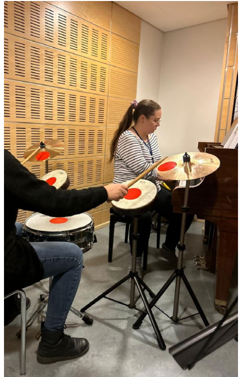
Treenaamassa Jyväskylän yliopistolla toisen musiikkiterapiaopiskelijan kanssa.

"Se on laajentunut ja monipuolistunut, painopiste on muuttunut. Vastuuta on tullut lisää. Osan uusista vastuista olen itse keksinyt itselleni, joitakin tehtäviä tuli annettuina. Tykkään laajasta,