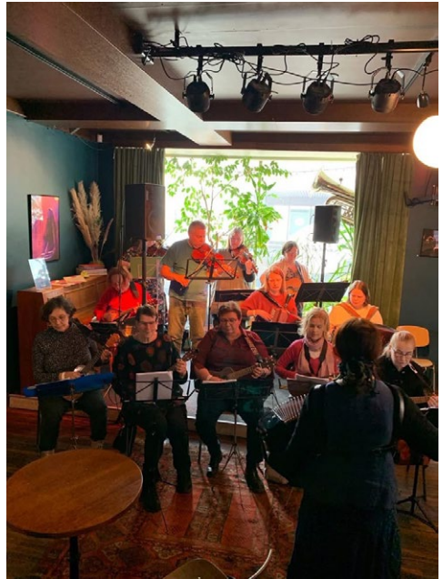
Käpylän pelimannit Samuelin poloneesissa.

Maaliskuussa kutsui Savonlinna ja Samuelin Poloneesi. Valtakunnallinen, jo vuodesta 1972 asti järjestetty valtakunnallinen kansanmusiikki-tapahtuma järjestettiin tällä kertaa Savonlinnassa 13.–15.3. Järjestäjänä on Suomen kansanmusiikkiliitto.