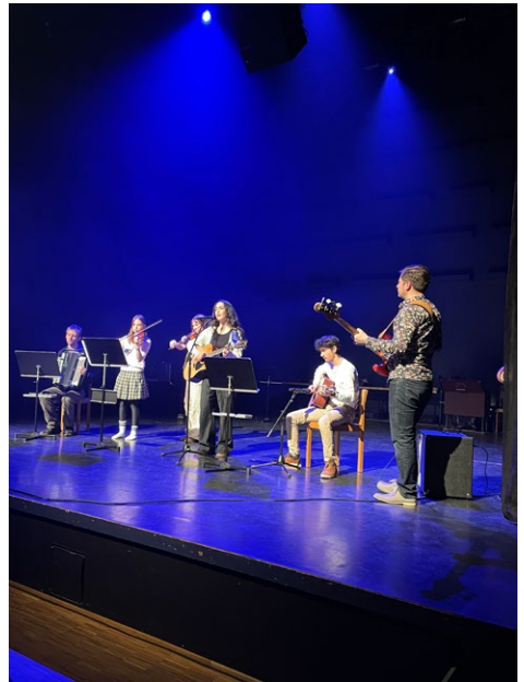
Kansanmustikat edustivat Käpylää tyylikkäästi