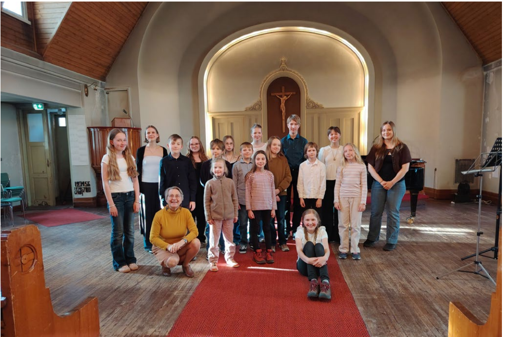
Projektin päätteeksi ryhmäkuva onnistuneen konsertin jälkeen. Lasten ja nuorten lied-konsertti soi Koskelan kirkossa 23.4.2026 klo 18.