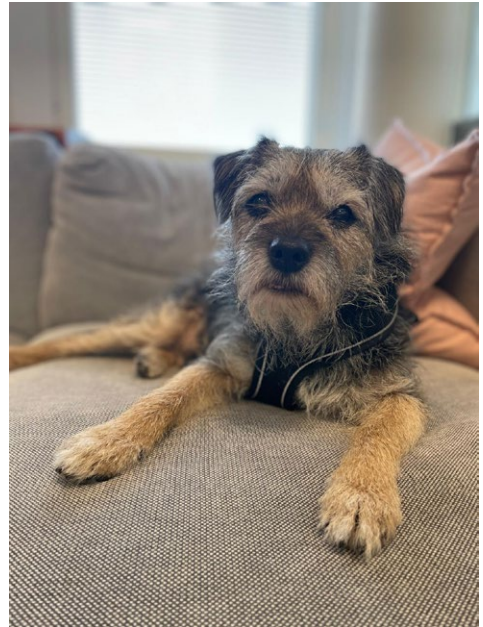
Annan koiria Bogey viihtyy myös työpaikalla!

”Ikäisekseen se on vielä hyväkuntoinen ja virkeä, vaikka kuulo onkin mennyt ja on dementiaa...”