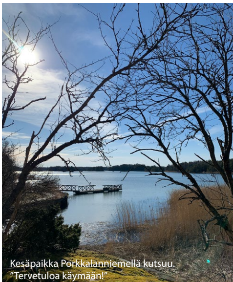
Kesäpaikka Porkkalaniemellä kutsuu. ”Tervetuloa käymään!”