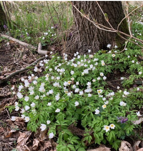
Varhaiset valkovuokot tänä keväänä!