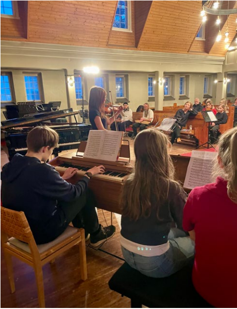
Tunnelmia Kamuviikon konsertista Koskelan kirkossa