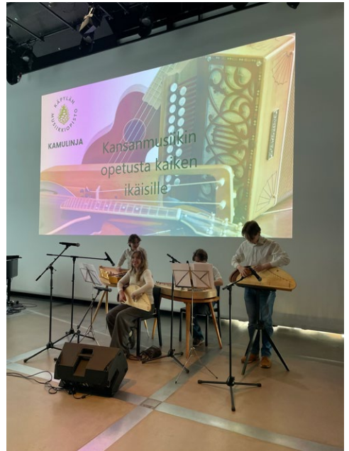
Kamuviikolla Oodissa esiintyjinä mm. Nohevat

Kevään 2026 Kamuviikkoa vietettiin 23.–27.3. kiertueen merkeissä. Juuret ja versot - nimellä kulkenut konserttisarja levittäytyi opiston ulkopuolelle ja oppilaat kävivät esiintymässä Kamusalin ja Koskelan kirkon lisäksi myös Maunula-talossa, Käpylän kirjastossa, Pasilan kirjastossa sekä keskustakirjasto Oodissa. Viikon aikana kuultiin laaja kattaus monipuolista musiikkia koko kamulinjan voimin.