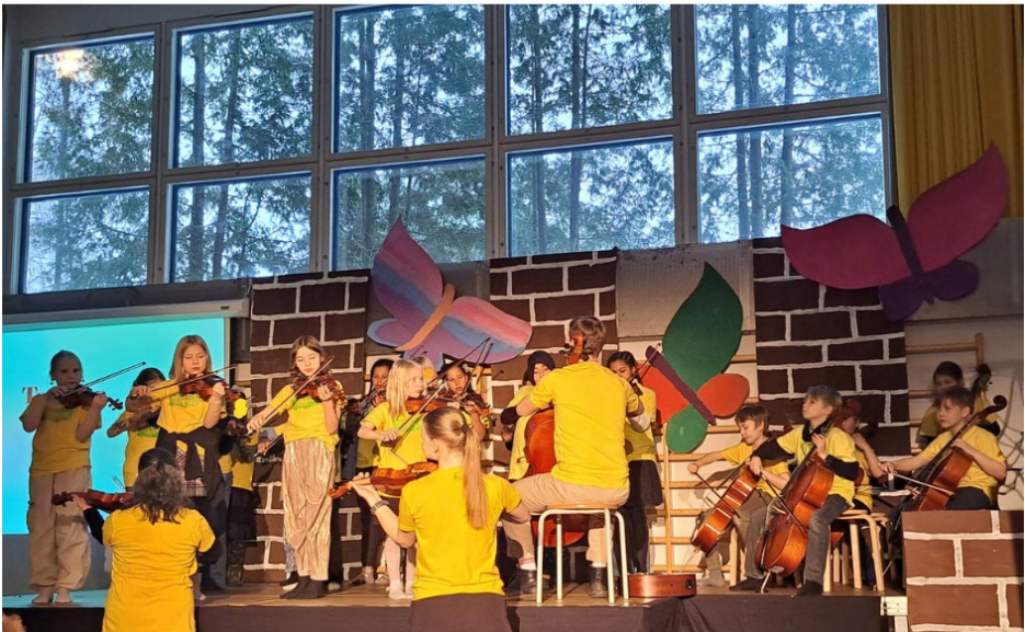
Tempo-orkesteri esiintyi Koskelan ala-asteen koulun 50-vuotisjuhliissa koulun juhlasalissa.