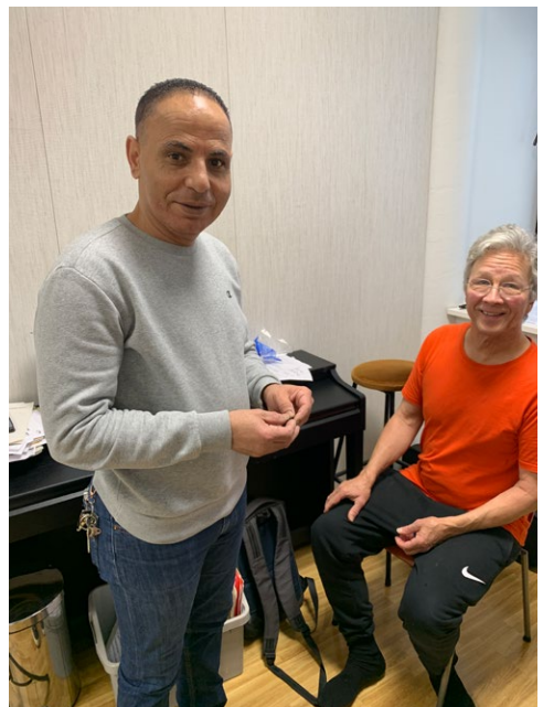
Ramadan auttoi Ahtia viulujen kanssa.