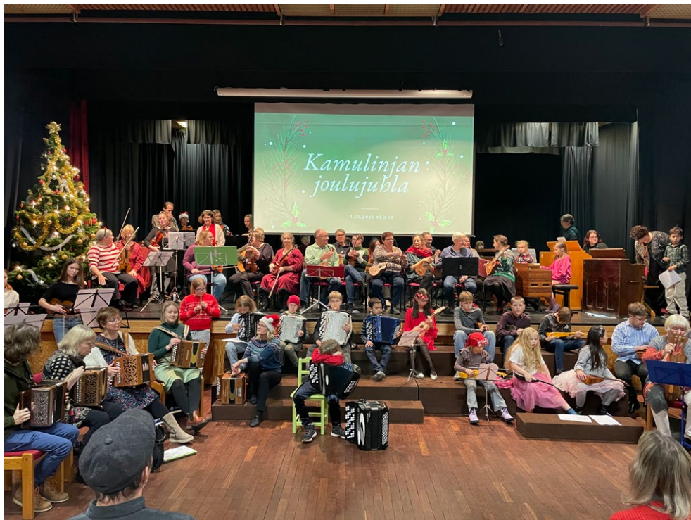
Kamulinjan joulujuhlassa olivat melkein kaikki.