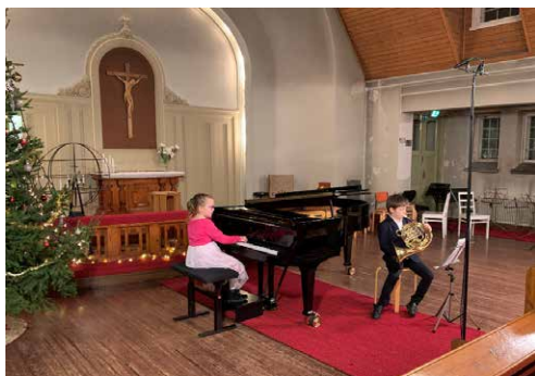
Sisarusten corno-piano -duo.

Tallenteella kuullaan ja nähdään rehtorin tervehdyksen lisäksi jouluisia esityksiä puhaltimilta, pianotriolta, harmonikkaduolta, jousiorkesterilta, sello- ja kitararyhmän esityksiä sekä