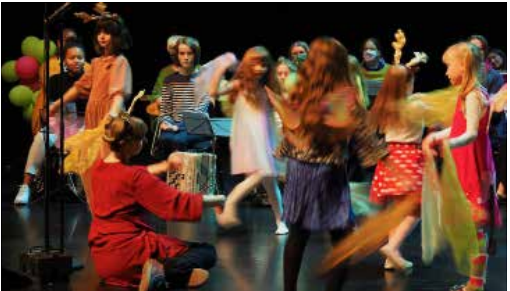
Lapsikuoro Villikot hurmasivat Malmitalolla..

Koska kaikki kamulinjalaiset eivät rajoitusten vuoksi mahtuneet mukaan näihin konsertteihin, päätettiin järjestää useita pienempiä tapahtumia saman viikon aikana.