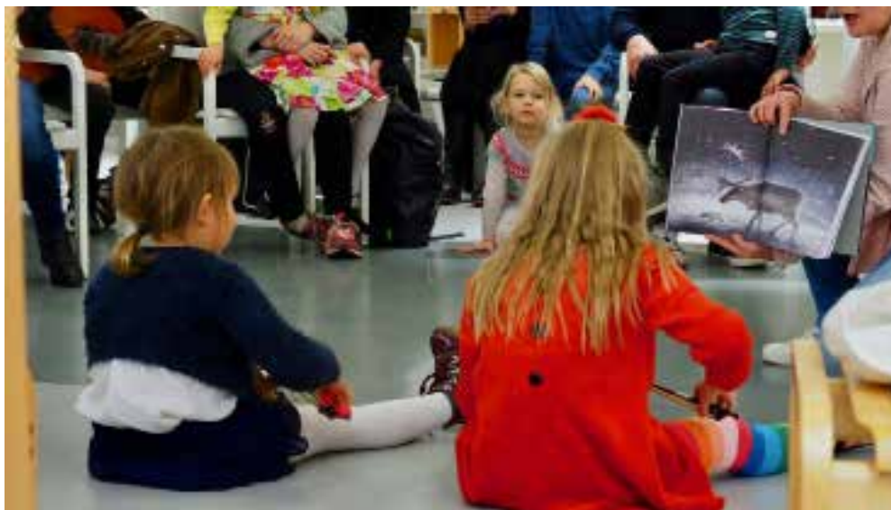
Pasilan kirjastossa myös improvisoitiin kuvasta.

Tiistaina 3.11. suunnattiin Pasilan kirjastoon, joka on ollut kamulinjan vakituinen esiintymisareena jo parin vuoden ajan. Tällä kertaa esiintymistiloja oli kaksi. Pianistit aloittivat auditoriossa sijaitsevan flyygelin äärellä, jonka jälkeen joukko musapajalaisia, viulisteja ja kitaristeja esittivät omat osuutensa kirjaston pääaulassa, iloisesti solisevan vesialtaan äärellä.