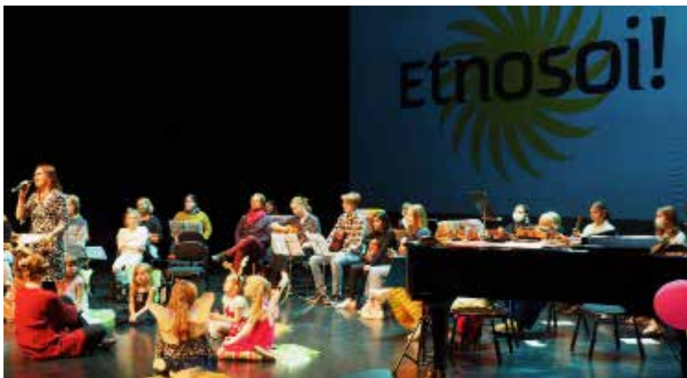
Malmisalin klo 16 konsertti.