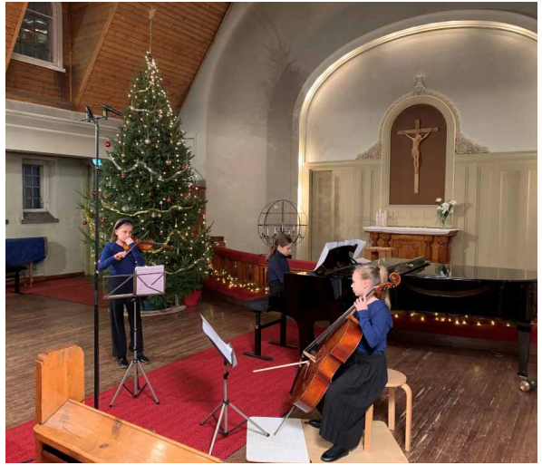
Pianotrio Safiiri lämmittelee.