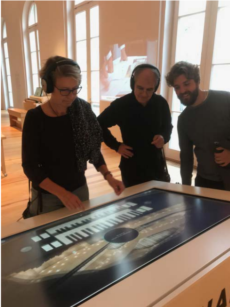
Hampurissa oli mielenkiintoinen soitinmuseo virtuaaliurkuineen. Pakko kokeilla!