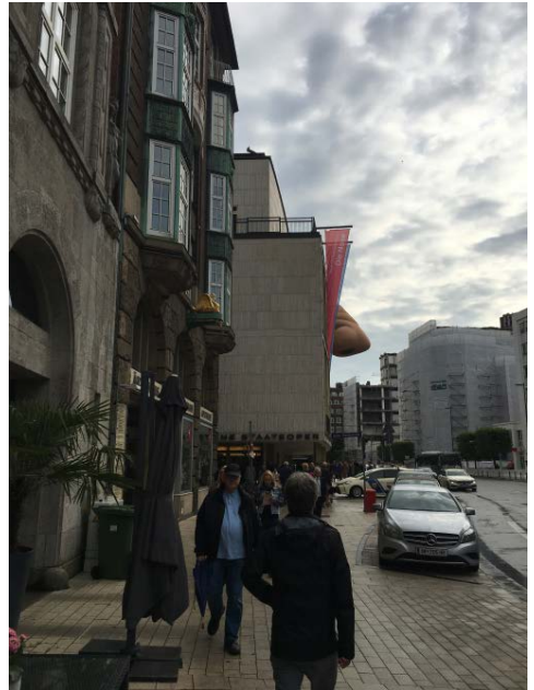
Osa porukasta onnistui saamaan liput oopperaan. Ohjelmassa oli Shostakovitshin ooppera Nenä. Oopperan sijainti oli metrosta ylös noustessa ensin hukassa, mutta löytyihän se sitten "nenällä" (ks. uloke).

Hampurin Elbphilharmonie -konserttitalo (oik.) näkyy kauas merelle rannalta upeana silhuettina. Myös sisätilat olivat viihtyisät, paljon puuta ja pehmeitä pintoja.