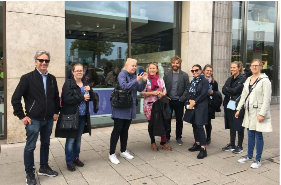
Kollegiaalisen suunnistuksen aloittelua operetkellä, Hampurin keskustassa.

Hampurin matkalla ihan kaikki tarpeellinen uusista kollegoista ei vielä paljastunut, joten syvähaastattelut ovat paikallaan.