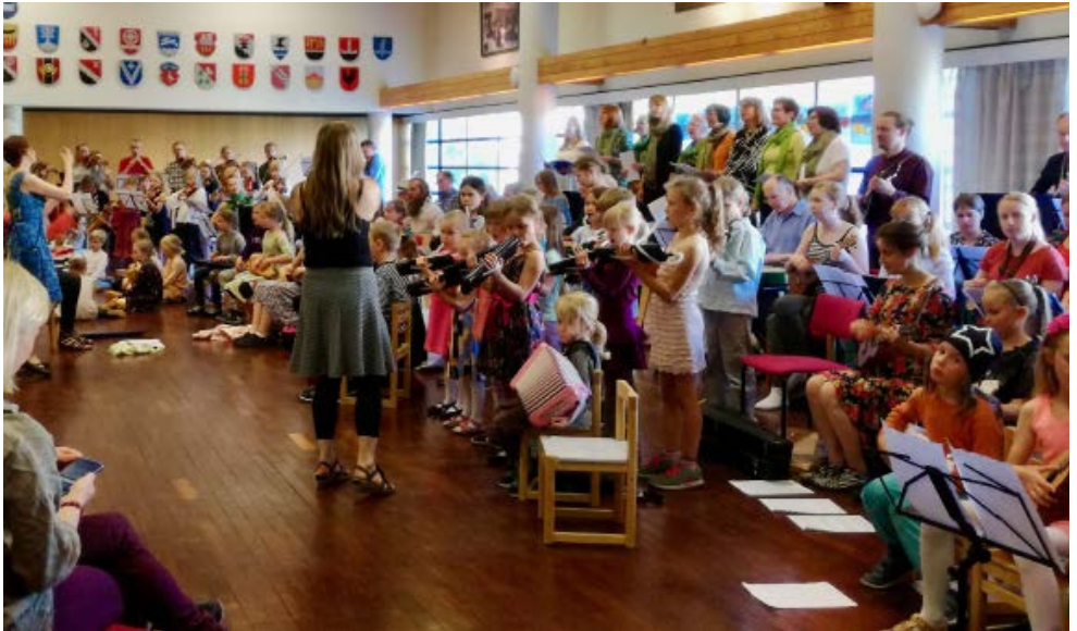
Kamulinjan juhlissa kaikki soittavat yhdessä. Kuva kevätjuhlasta 2018.