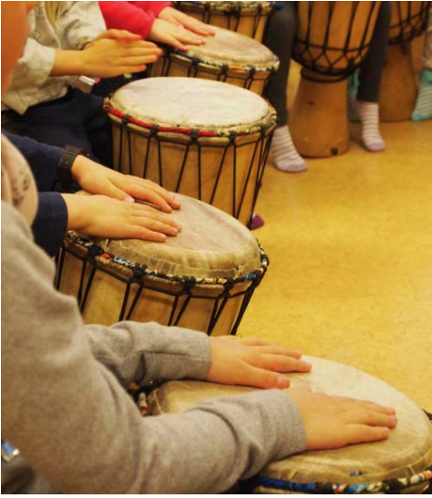
Djemberummutusta Koskelassa.