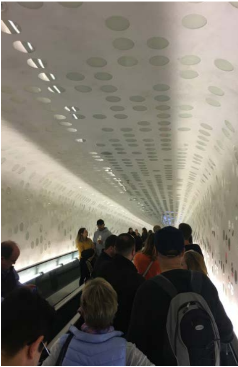
Elbphilharmonien sisäänkäynnissä on muuten myös Euroopan pisimmät, kuperat (Koneen!) liukuportaat.